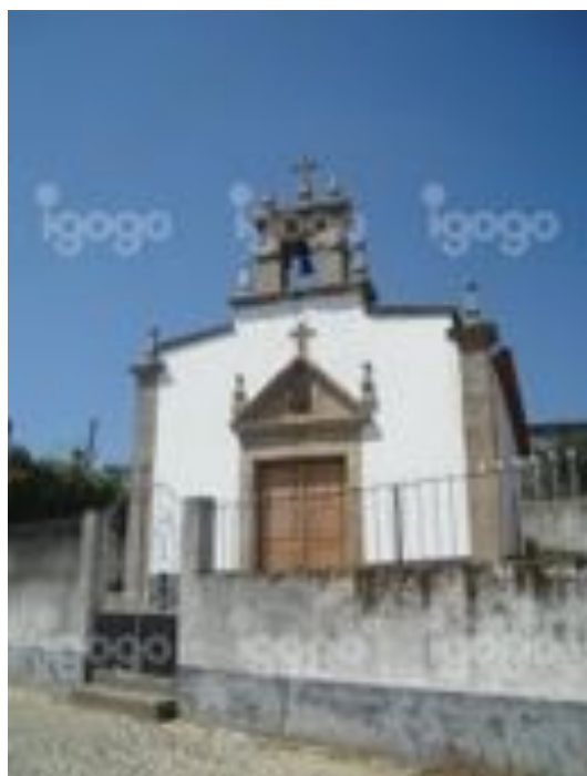
Capela de Santo André em Rendufe