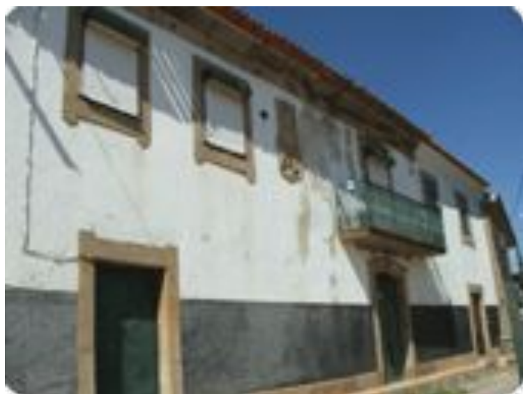
Casa dos Cardosos na Rua Direita de Santa Maria de Émeres