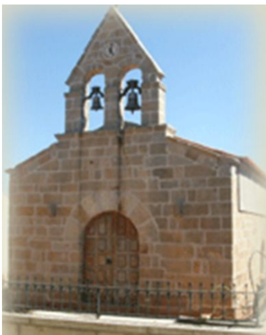
Igreja de N. Sra. da Expectação